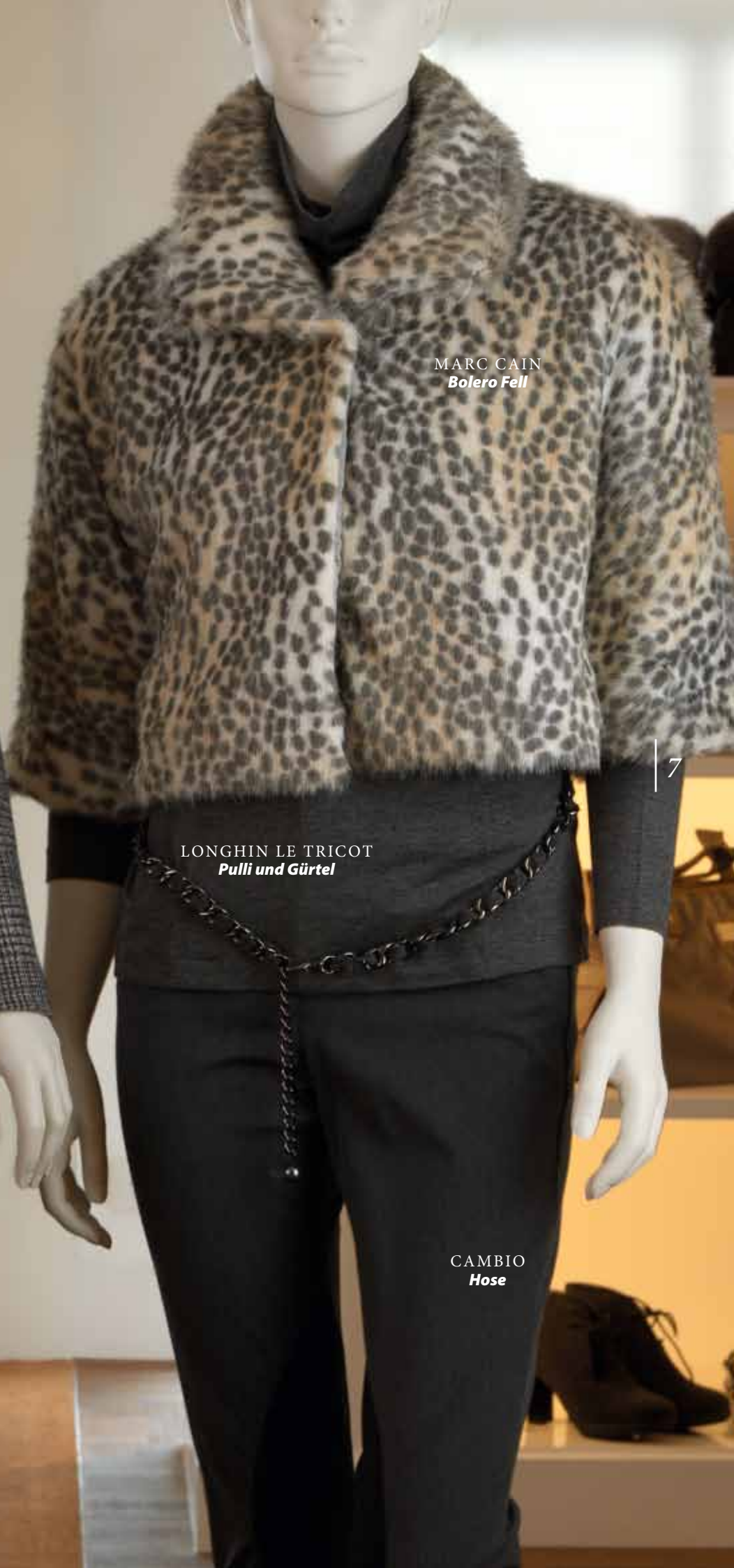
MARC CAIN Bolero Fell