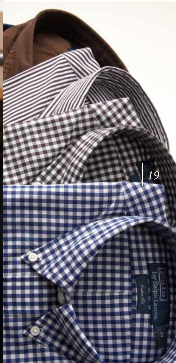
POLO RALPH LAUREN Hemden