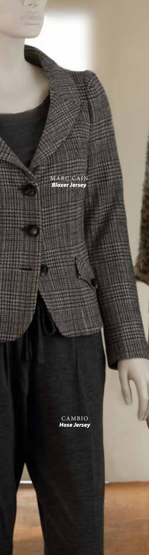
MARC CAIN Blazer Jersey