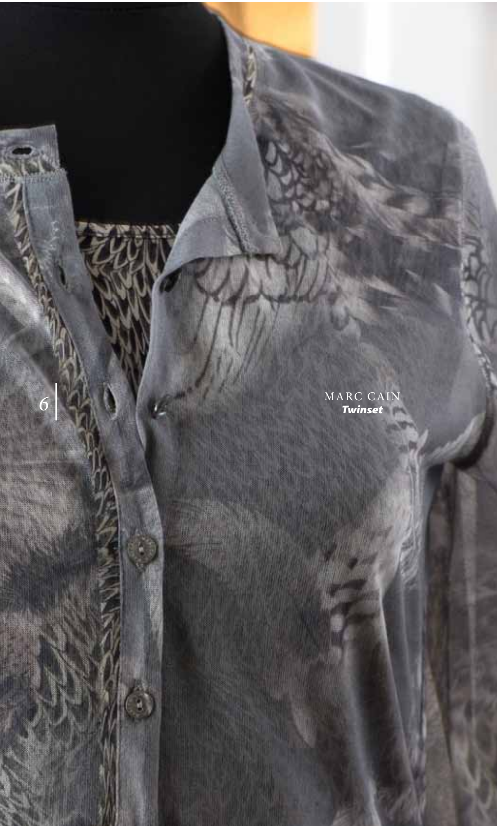
MARC CAIN Twinsset